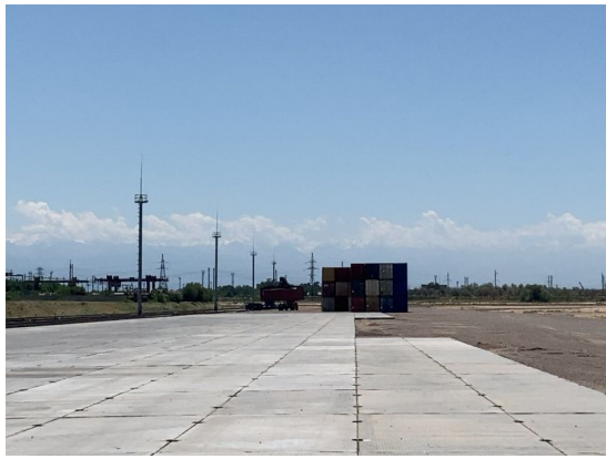
Eastcomtrans社ジェティゲン・ターミナル建設地