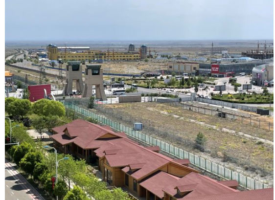
国境協力国際センター内「ホルゴス」、カザフ側区域