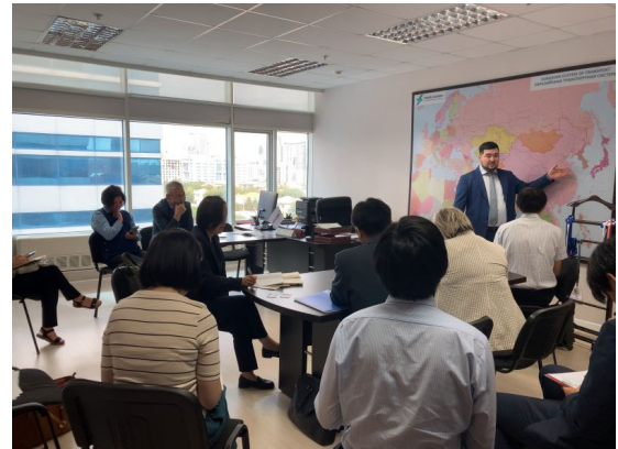
国際協会「トランスカスピ国際輸送ルート」との面談