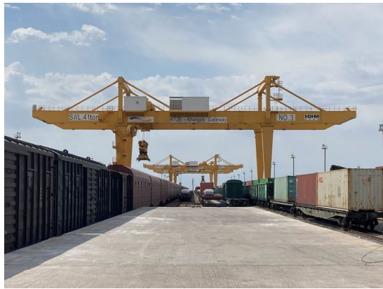
ホルゴス・ドライポートの積み替えプラットフォーム