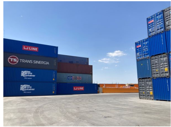
Atasuグループ・ブルンダイ・ターミナル