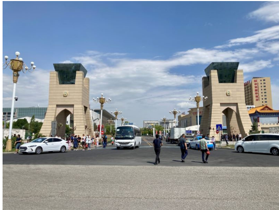
国境協力国際センター「ホルゴス」内、中国側区域