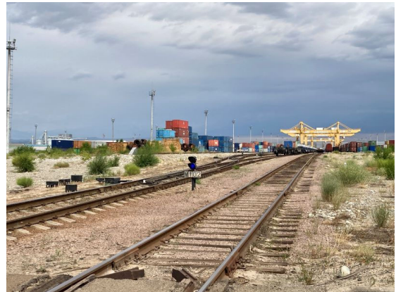
ホルゴス・ドライポート内、手前の線路が中国へ至る